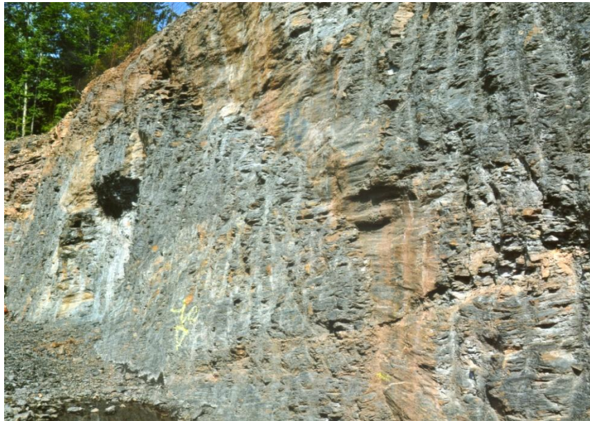
Fig. 6 -Giacimento flora fossile di Tregiovo. Porzione sommitale