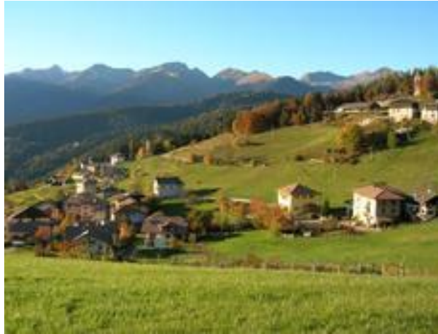
Fig. 2b- La frazione di Tregiovo (TN)

ultimi identificabili con i martiri Candido ed Esuperio), sorge al centro dell'abitato, con orientamento a nord. L'edificio fu costruito da maestranze locali tra il 1788 e il 1789 in sostituzione dell'antica chiesa del paese, che si trovava sul colle a monte dell'abitato e della quale rimane solo il campanile.