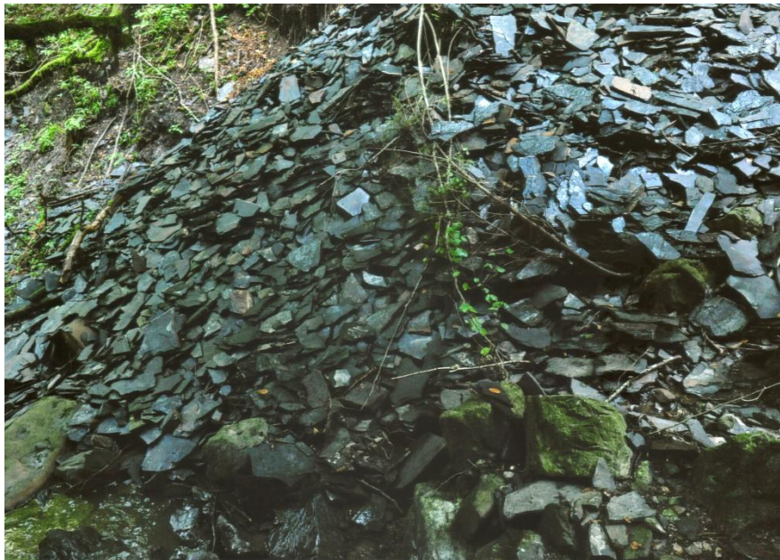
Fig. 3- Giacimento flora fossile di Tregiovo- Particolare strati inferiori

Sono comuni i ritrovamenti di impronte di tetrapodi e di numerosi resti vegetali (Marchetti et al., in press). Materiale storico proveniente da Tregiovo, oggi depositato presso il Museo Civico di Storia Naturale di Brescia, ha evidenziato anche la presenza di piccoli conostraci che abitavano negli specchi d'acqua dolce presenti. La sezione di Tregiovo è rappresentata da diverse facies: le facies basale e superiore formate da conglomerati e arenarie indicano condizioni di alluvionali mentre la parte intermedia è formata da laminiti di ambiente lacustre.