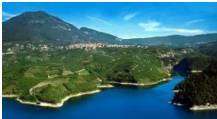
Fig. 2a- Il lago di Santa Giustina

Revò (in dialetto noneso Rvòu) è un comune di 1.273 abitanti della provincia di Trento. Si trova in Val di Non ed è affacciato sul Lago artificiale di Santa Giustina (bacino realizzato negli anni 1950-55), tra le incisioni dei torrenti Novella e Pescara (fig. 2a). Chiamato balcone d'Anaunia data la vista sul territorio circostante di cui gode, il paese è riconoscibile da lontano per via dei suoi due campanili: quello della chiesa di S. Stefano, il più alto, inizialmente una torre di osservazione romanica, a cui venne aggiunta la cella campanaria nel '500 e la chiesa di S. Maria, risalente al XVIII secolo dal tetto a cuspide ottagonale. Sulle panoramiche balze che digradano verso il lago, oggi intensamente coltivate a frutteto, un tempo prevalevano le viti produttrici del "groppello", vino rinomato in valle e fuori. Oggi, a testimonianza di un paesaggio superstite è il grappolo d'uva nello stemma del paese del paesaggio agrario scomparso, rimangono qualche vigneto.