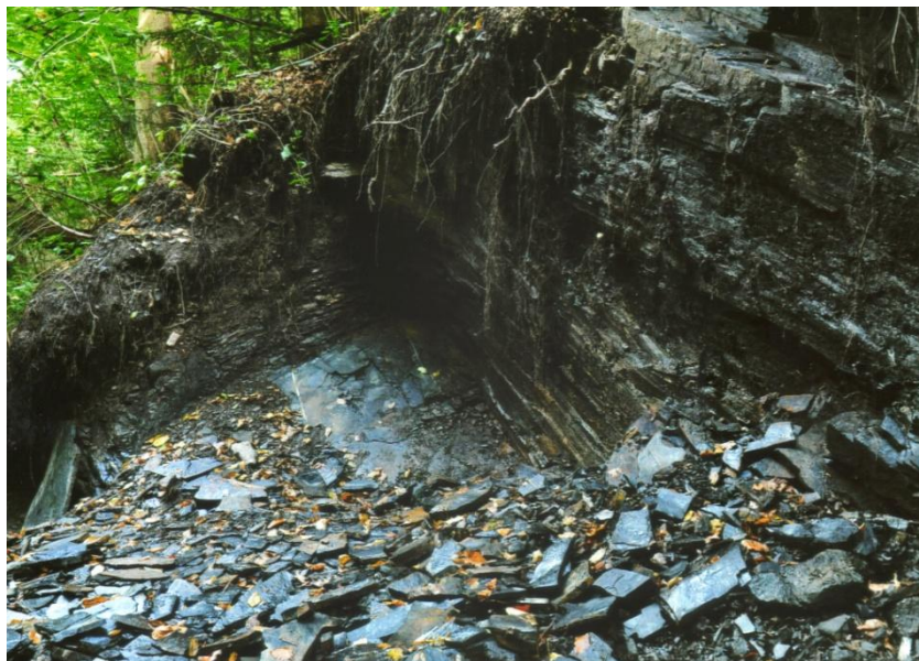
Fig. 5 Giacimento flora fossile di Tregiovo. Porzione degli strati superiori