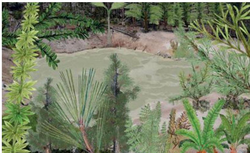
Fig. 9 - Ricostruzione della flora Permiana nella parte alta di Tregiovo: gli antenati del pino, Valentinia angelellii , Valentinia cassinisi , la felce Sphenopteris battistii , le cicadofite Nilssonia perneri e, Bjuvia tridentina , le conifere Ortiseia daberii , Cassinisia ambrosii , l'equiseto Annularia galioides , il lycopodio gigante Sigillaria brardii . (Da: T. Perner, e M. Wachtler, 2014)

Anche gli equiseti giganti sono ampiamente rappresentate da Neocalamites tregiovensis e dai loro ramoscelli diramati chiamati Annularia . Sorprendentemente, le felci rivelano una presenza molto più marginale, esclusivamente limitata a specie come Sphenopteris battistii ed alcune pteridosperme come Lepidopteris meyeri o Autunia , tipica per le sue macrosporofilli peltate.