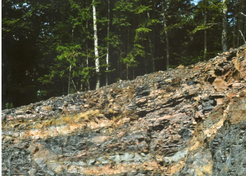
Fig. 4 Giacimento flora fossile di Tregiovo - Particolare delle numerose lastre negli strati inferiori ( foto 2012 studio Flaim V. , Cles-Revò)